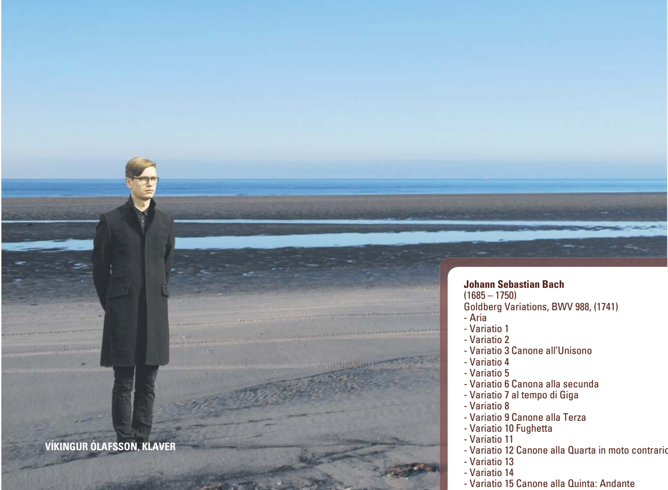
VÍKINGUR ÓLAFSSON, KLAVER